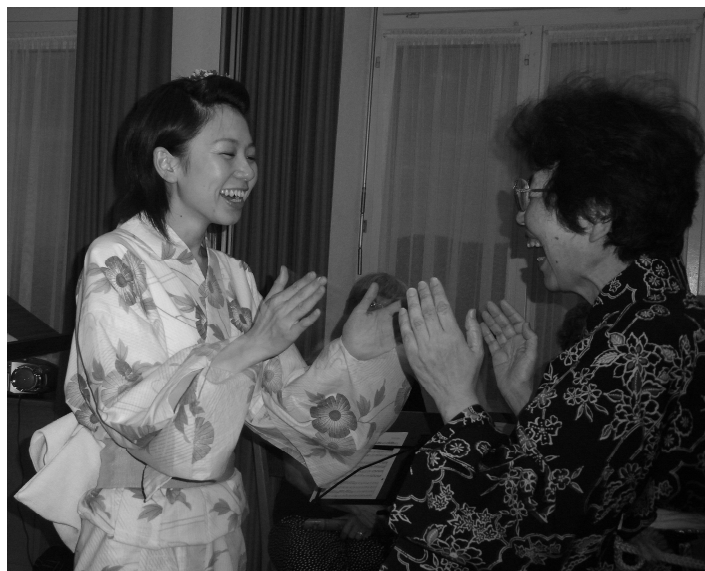
Unsere Japanerinnen auf dem Bienenberg