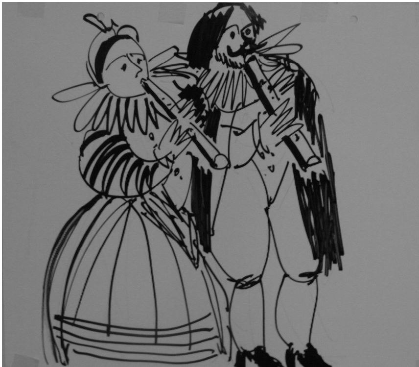
Zeichnung: Bärnie Wyss