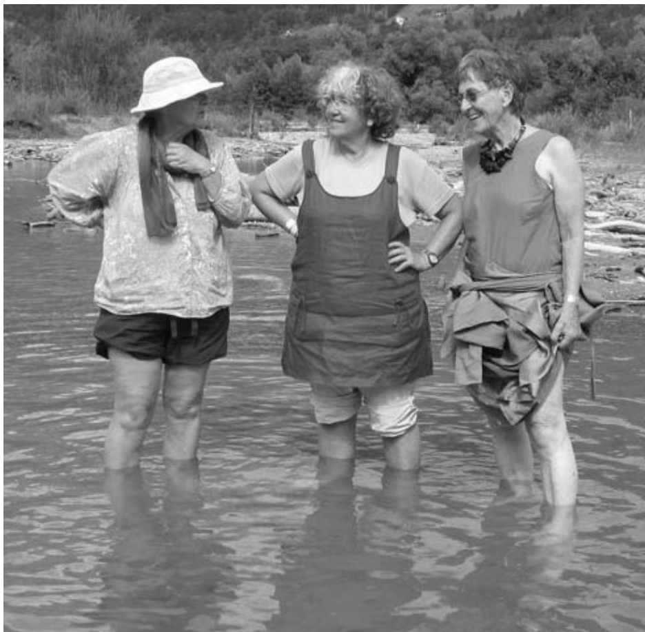
So lässt sich gut diskutieren / C'est formidable de discuter