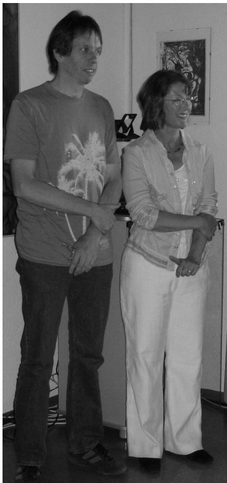
Vernissage 2. Juli 2011