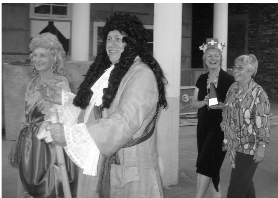
Einzug der neuen internationalen Präsidentin Regina Rüeegg