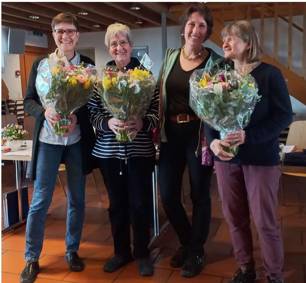
Danke an die Editionscommission/ Merci à la commission d'édition