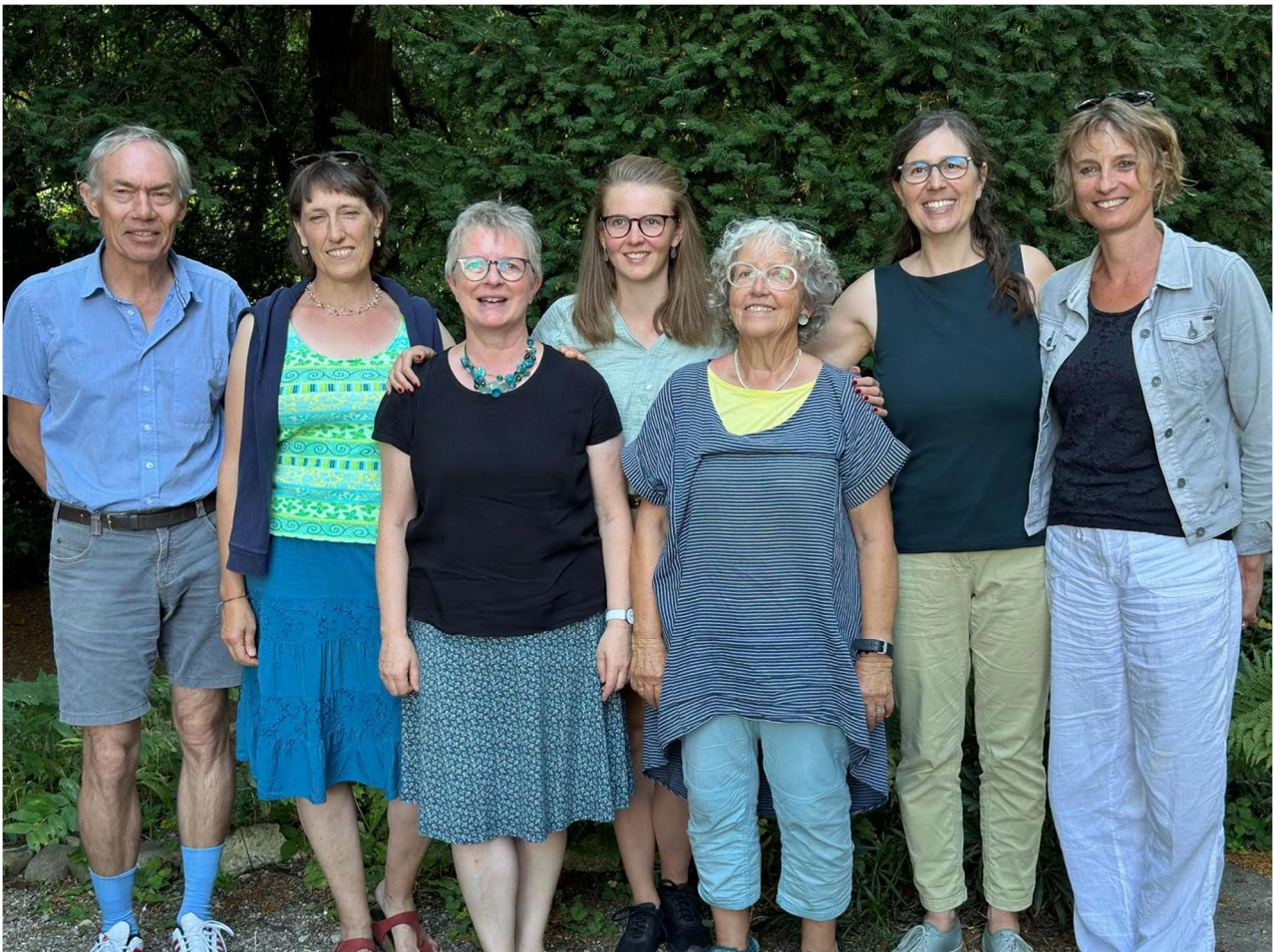
Vorstand / Comité 2024