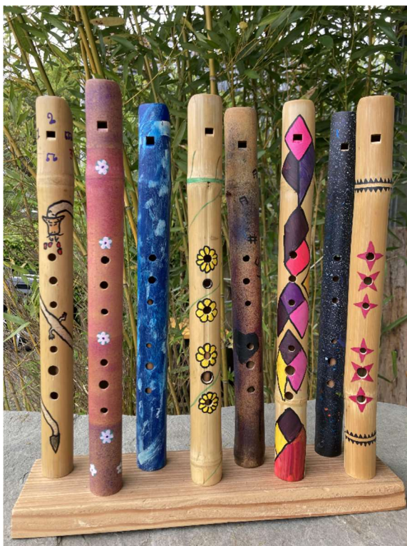
Flöten aus dem regionalen Intensivkurs Plus (siehe Seite 30) Flûtes du Cours intensif régional Plus (voir à la page 32)