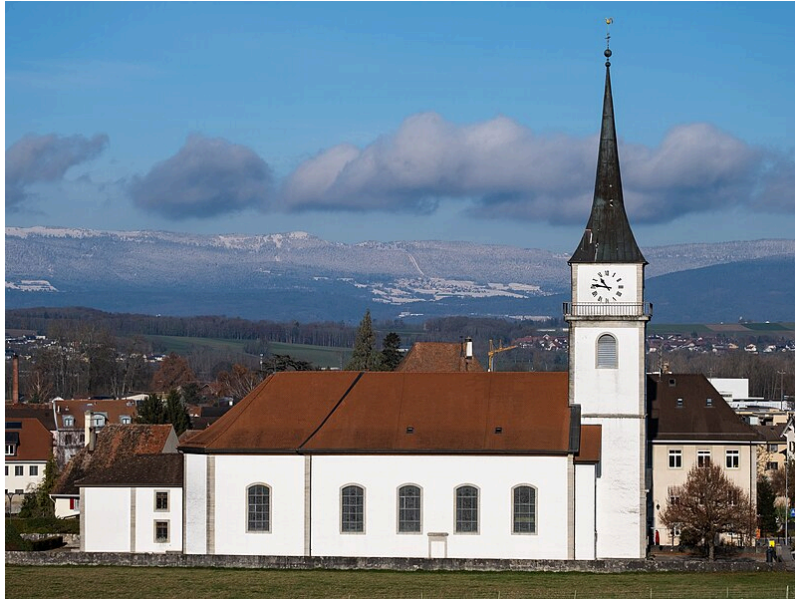
Fichier :Église paroissiale Saint-Didier de Domdidier/FR-(wikipedia.org)